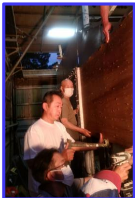
奥でマスクをして指示しているのが私です。