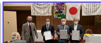
三役への感謝状贈呈式