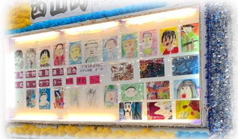
陽光の園の作品が山車のメインです。

計画段階からエイペック・スポーツ、熱海見番の協力と観光協会からの支援を頂き、コンクールでは総合優勝の栄冠を頂きました。私達だけではまだまだ力不足ですが協力し合い「初めての障害者参加型」の祭りに参画できたことは意義深いものとなりました。