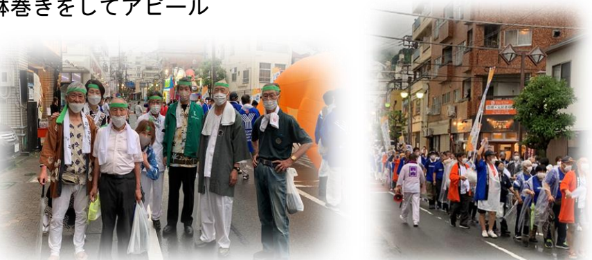
グローリーサポーターいざ出陣です。