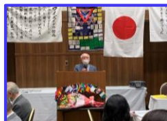
陣内会長最終の挨拶