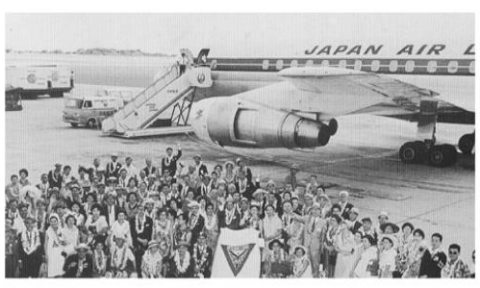
1966年ハワイ世界大会