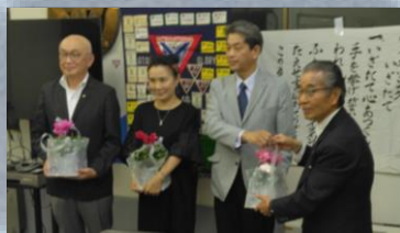
誕生日おめでとう

9月例会が9月27日(水) 18:30より静岡YMCAセンターで開催されました。